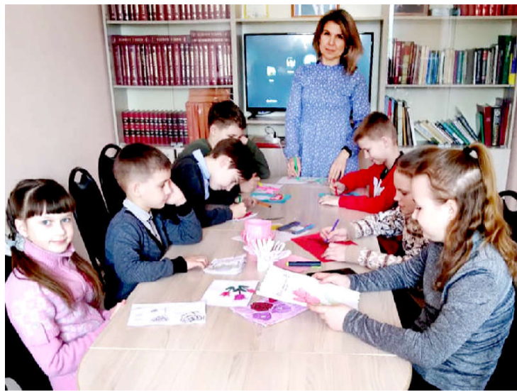
Краеведы готовятся к выставке.

К сожалению, далеко не всем нам это кажется интересным, поэтому не секрет, что в музеях (за редким исключением) не бывает аншлагов, и толпами туда ходят только на организованную экскурсию. А если музей даже не в городе, а как тот, что у нас в Бабынино? Как часто мы бываем в нем, хотя и расположен под боком, и вход бесплатный?